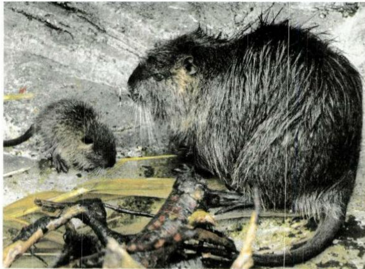
Nutria-Nachwuchs im Zolli

Am Samstag, 10. März, und Sonntag, 11. März: Filmfestival für die Öffentlichkeit.