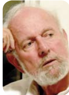
Prof. Dr. Ernst U. von Weizsäcker, Dekan der Bren School of Environmental Science and Management, Santa Barbara, Kalifornien (bis Ende 2008), Ko-Vorsitzender des International Panel for Sustainable Resource Management, ehemaliger Präsident des Wuppertal Instituts