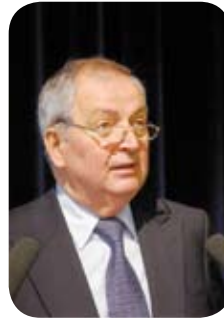
Klaus Töpfer, ehemaliger Generaldirektor des UN Umweltprogramms UNEP

Unter den Referenten der ersten vier NATUR Kongresse waren