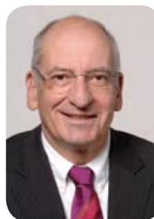
Pascal Couchepin, Bundespräsident, Vorsteher des Eidgenössischen Departements des Innern (EDI)