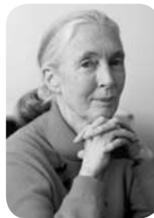
Jane Goodall, Dame of the British Empire, Friedensbotschafterin der Vereinten Nationen, Schimpansenforscherin und Gründerin des Jane Goodall Instituts (JGI)