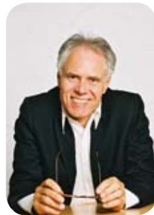
Moritz Leuenberger, Bundesrat und Vorsteher des Eidgenössischen Departements für Umwelt, Verkehr, Energie und Kommunikation (UVEK)