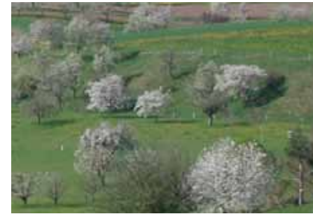
Hochstamm-Obstgärten fördern die Artenvielfalt