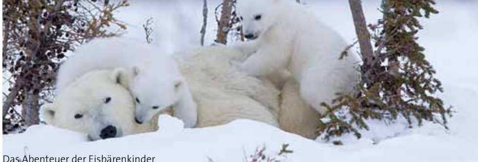
Das Abenteuer der Eisbärenkinder

Besuchen Sie unser Filmfestival und lassen Sie sich in die faszinierende Welt der Tiere und Pflanzen entführen. Im fasziNATUR-Kino erleben Sie die Wunder der Natur auf Grossleinwand. Eine Attraktion für die ganze Familie.