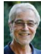
Dr. Hans Rudolf Herren, Lauréat du Prix mondial de l'alimentation, co-président IAASTD, président du conseil de la Fondation Biovision