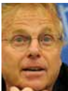
Daniel Cohn-Bendit, Parlementaire de l'Union Européenne