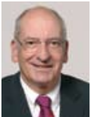
Pascal Couchepin, président de la Confédération, chef du Département fédéral de l'intérieur (DFI)