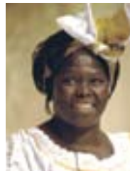
Prof. Dr. Wangari Muta Maathai, premier prix Nobel de la paix africain, Kenya, fondatrice du Green Belt Movement