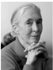
Dr. Jane Goodall, Dame of the British Empire, messagère de la paix pour les Nations unies, spécialiste des primates et fondatrice du Jane Goodall Institut (JGI)